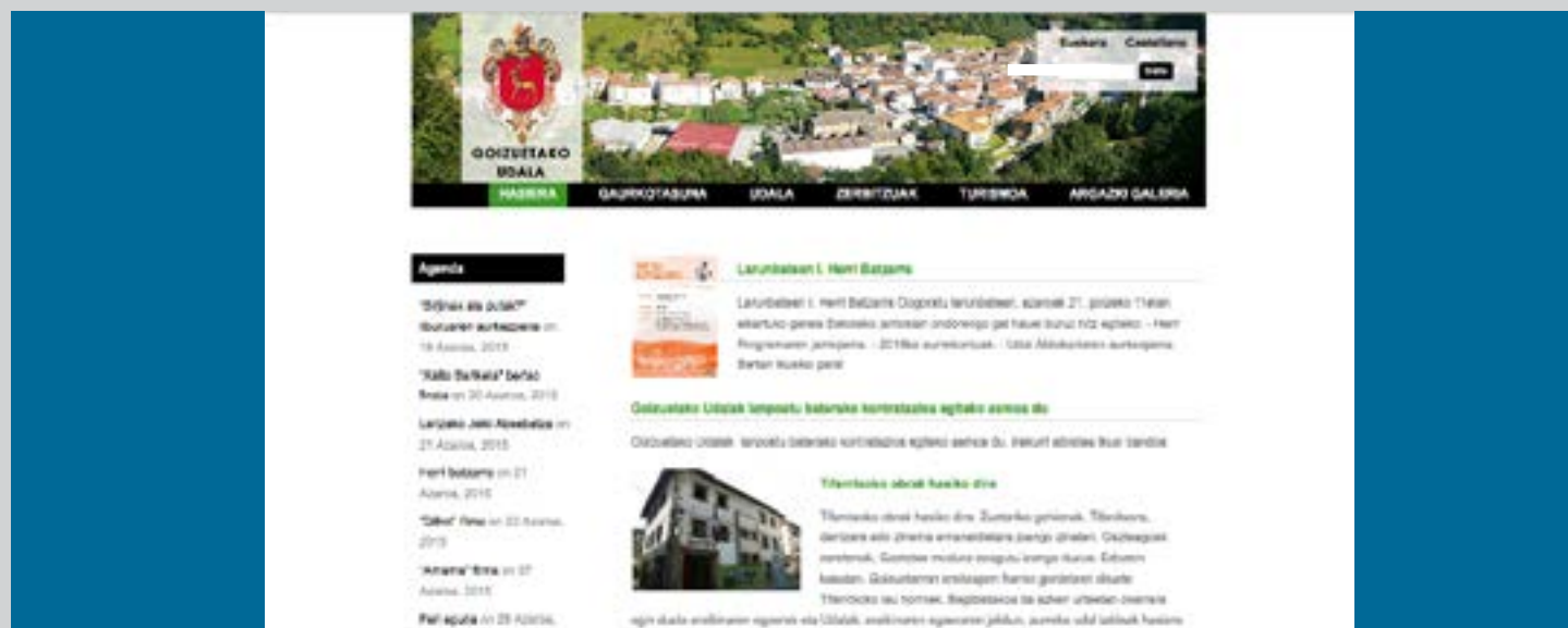
Goizuetako Udalaren web orria.

Udalaren komunikazio tresnak martxan daude: aldizkaria, herri batzarrak eta web orria. Idatzian, zuzeneko harremanetan eta interneten.