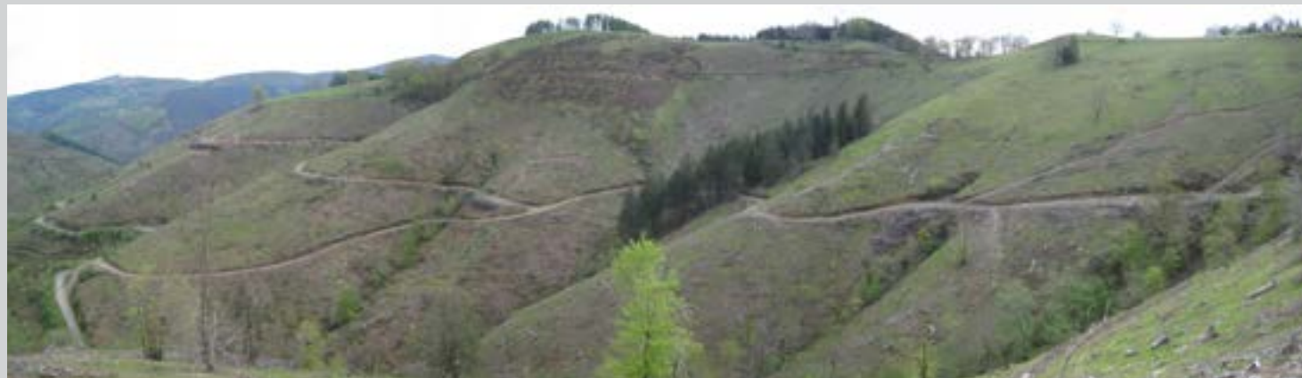
Burugorriko ikuspegia iparraldetik.

Aipatu baita ere, herritarrek sutarako erabiltzen duten egur lotea ateratzea 8.530,50€ kostatu zitzaion 2015ean Udalari. Eskatzaileei kobratzen zaiena, kostu horren arabera da.