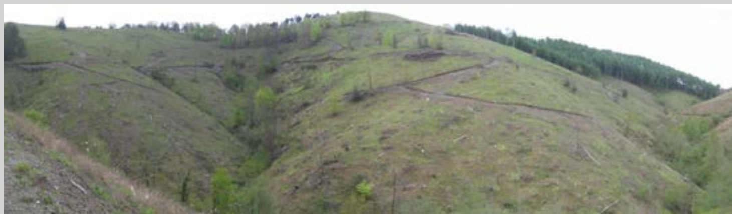
Burugorriko ikuspegia hegoaldetik.