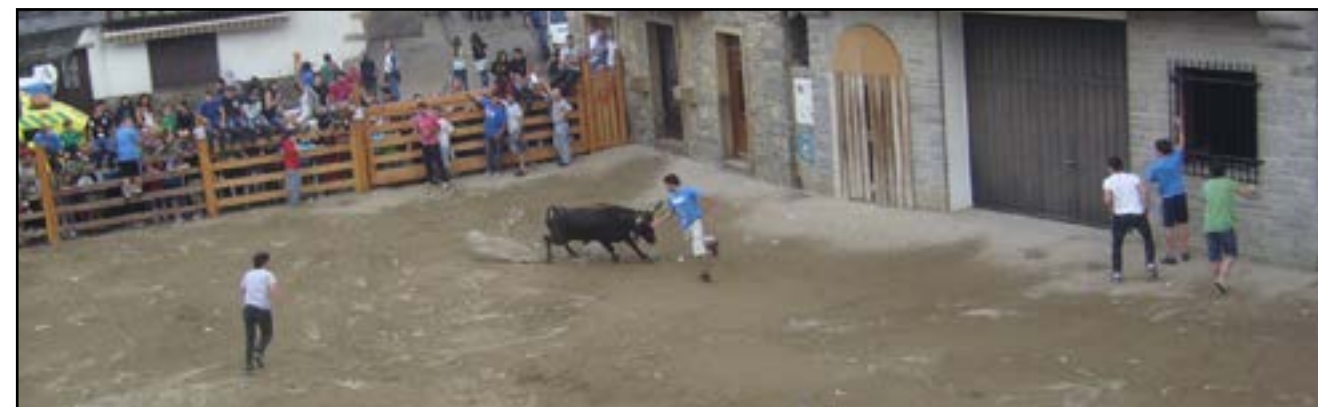
Lasturren zezenak herriko jaietan.

Hainbat ekintza aipatzearen: umeen egunean trialsin ikuskizun berezia egingo da; abuztuaren 14ko txupinazoa indartzeko, erraldoien topaketa egingo da; 15 arratsaldean, bi ekitaldi egingo dira, herri kirolak eta bertsolariak; 17an Nafarroako jotez gozatzeko aukera izango dugu; eta 18 iluntzean Zo-zongo batukadak alaituko ditu kaleak.