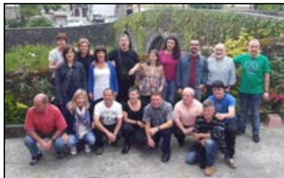
Ekainaren 4ko hamaiketakoa.