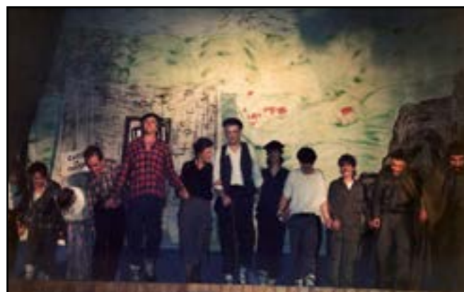
“Goizuetan bazen” 1990ean Leitzan egindako emanaldia.

“1990ean lortutako arrakasta errepikatuko ote da?”