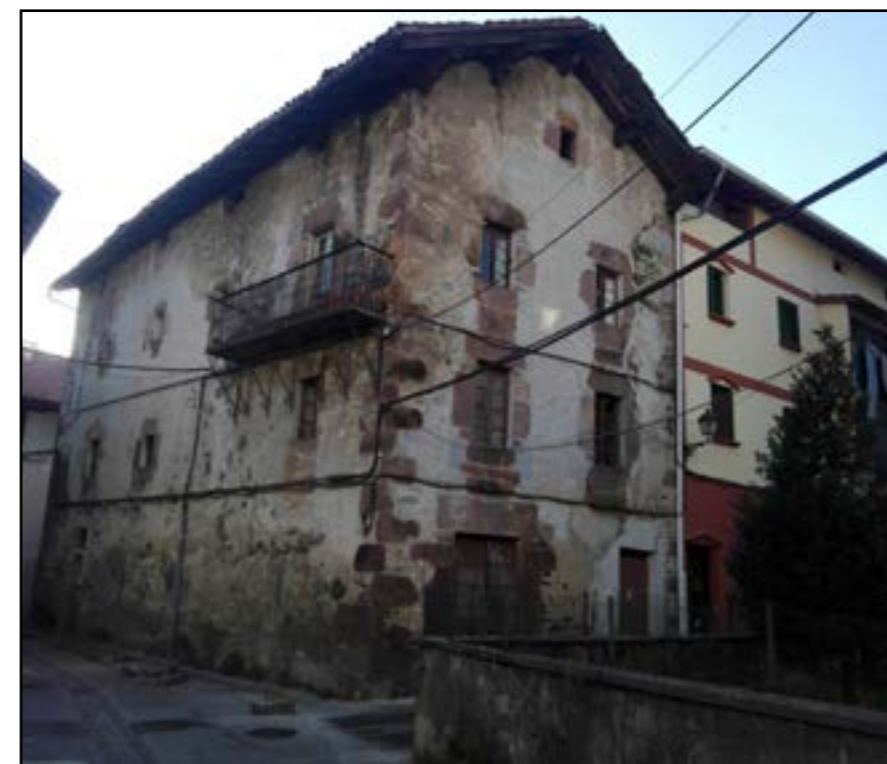
Ospital zaharraren egungo itxura.

Nafarroako Gobernuarekin ere harremanetan bagaude diru laguntzen inguruan. Beraz, aukera ezberdinak aztertu eta beharrak zein diren baloratuz, ikusi behar da ospitalean egingo den obra nolakoa izango den.