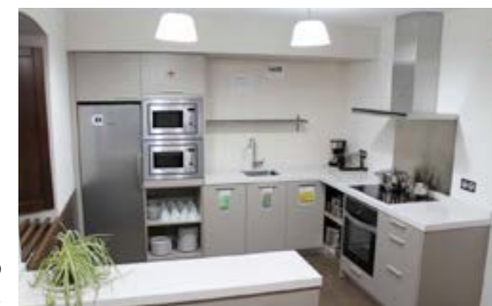
Zubimuxu aterpetxeak sukaldeko zerbitzua ere badu orain.