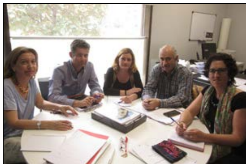
Etxebizitzari buruzko bilera Iruñean.

Beste hainbat gairen artean, Goizuetan etxebizitzaren inguruan egindako lanketa aurkeztu genien eta ospitalaren inguruan ere hitz egin genuen; proiektuaren inguruan egon zitezkeen aukera ezberdinak aztertu eta kasu bakoitzean jaso genitzakeen diru laguntzak ikusi.