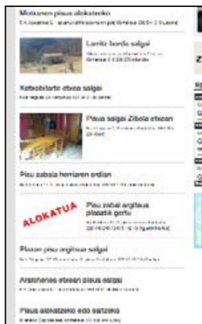
Etxebizitza eskaintzen tabloia.

Goizuetan hutsa duzun, erabiltzen ez duzun edota behar ez duzun etxe edo lokal baten jabe bazara, eta erabiltzeko interesa duen norbaiti alokatu edo saldu nahi badiozu, idatzi etxebizitzabatzordea@gmail.com helbidera edo jarri zuzenean udalarekin harremanetan.